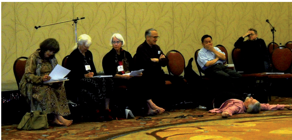
Hoàn Toàn, nghị viên tâm linh Mỹ và đại hội